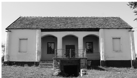
A Berzsényi-pince Kemenessömjénben

A Berzsényi-pince szerencsésen átvészelte a változásokat, a tsz-évtizedeket köztulajdonként. Az épület mellett áll a harmincas évek közepétől – az agg cseresznyefa helyén – az évfordulós emlékoszlop a már ismerős évszámmal (felirata: „E helyen állott / vén cseresznyefa árnyékában / írta magasszárnyalású ódáit / 1799–1808 / Berzsényi Dániel”). Látha-