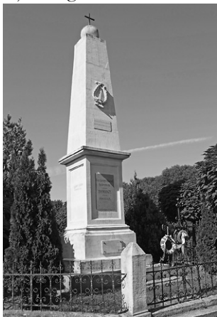
Berzsényi síremléke a niklai temetőben

Már régen nem ül ide ki senki. A mostani látogató az üres, befüvesített semmit látja. Meg azt: már csak néhány eltévedt darázs látogatja a közeli gyümölcsösből az