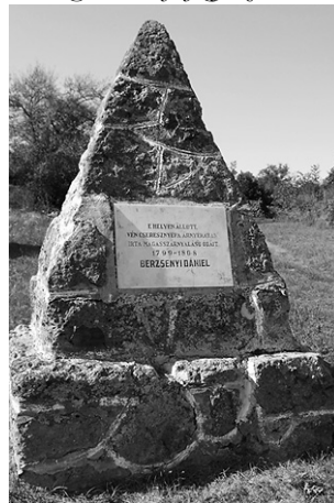
A pince melletti emlékoszlop

Az egykori szerény kúria további sorsáról annyi tudható, hogy a 20. század elején a Berzsényiektől a Radó család vette meg a házat, de nemsokára Szűts Istvánné Radó Mária tovább is adta Szenté Mihály gazdának. Az új tulajdonosok 1917-ben „pajtává alakították át úgy, hogy egyik (hátsó) szobáját és a tornácot lebontották, az ablakokat betéglázták, a falak magasságát pedig emelték.” 6 Napjainkban a Berzsényi utca 57. számú házon sajnos alig-alig vehető észre az az emléktábla, amelyik a bejárat közeléből néz az utca helyett az udvarra, rajta téves évszámmal („E ház udvarán állt / egykori kuriában / lakott 1799-től 1808-ig / Berzsényi Dániel”). Néhány száz méter után, a Berzsényi-mellszobornál érdemes újra elidőzni. Ezzel átellenben, a kultúrház bejáratánál újabb tábla: a felirata arra emlékeztet, hogy Németh László 1937-ben felkereste a falut. Az évszám itt sem pontos, ugyanis látogatásának az élményét már korábban, 1936-os datálással publikálta Esték Sümege n címmel. Ebben a beszámolójában szerepel: a helyiek „Valósággal kézzel adtak az úton, s ha hülye lettem volna, akkor is föl kellett volna jutnom alkotmányig a csodálatos fekvésű Berzsényi-szőlőhöz”. 7 Nekünk, helyismerettel rendelkezőknek, autóval pár perc alatt sikerült ez.