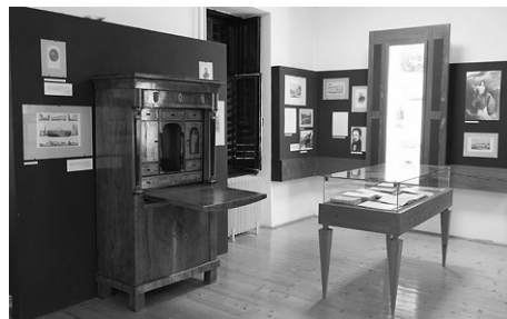
A niklai múzeum szoba-részlete

Még magasan jár az augusztusi Nap, amikor belépünk a niklai ház árnyas előkertjének patetikus csöndjébe. Az ágaskodó, kapaszkodó növények takarásában megbújó házról tudjuk, hogy a család nem ebbe költözött be. Az eredeti ennél szegényesebb volt, bár a sömjéni hajléknál valamivel nagyobb. A niklai körülményeiről maga Berzsenyi számol be évekkel később, 1810 szeptemberében Kazinczynak: „somogyi jószágomat kiváltván, többet kaptam rétben és szántóföldben ezer holdnál, s úgy szintén egy igen szép szőlőt, mely hat- s hétszáz akó legjobb bort terem.” 10 Ugyanezen év végén szinte dicsekedve írja apjának: „Ez ősszel ismét két szőlőt vettem [...] úgyhogy már most a hegybeli birtokomat kétannyira szaporítottam [...] Az én szőlőm már most egy közönséges falunak jövedelmét adja nékem, földem annyi van, hogy én sohasem tudom felét is megszántani.” 11